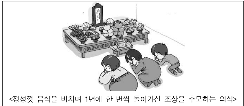
<정성껏 음식을 바치며 1년에 한 번씩 돌아가신 조상을 추모하는 의식>

19. 그림에 나타난 의식(儀式)에 대한 설명으로 가장 적절한 것은? [3점]