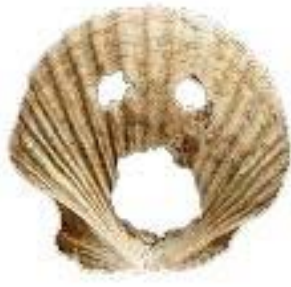
부산 동삼동 출토