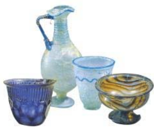
황남대총 출토 유리 용기