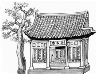
왕이 죽은 후 춘추관에 편찬 기구 설치

2. 다음과 같은 과정을 거쳐 편찬된 유네스코 세계 기록 유산으로 옳은 것은?