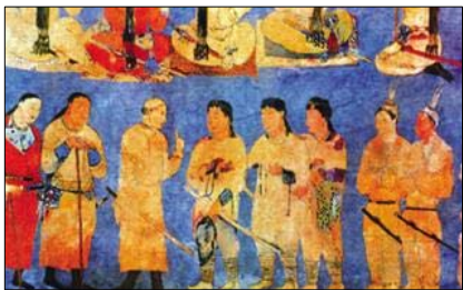
아프라시아브 궁전 벽화