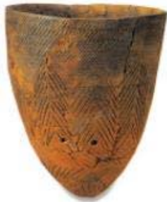
서울 암사동 출토