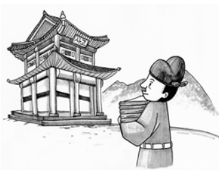
완성본을 인쇄하여 한양과 지방의 사고에 보관