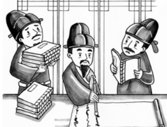
여러 차례의 수정을 거쳐 완성