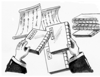
사관들이 작성한 사초와 각종 행정 기관의 기록물 수집